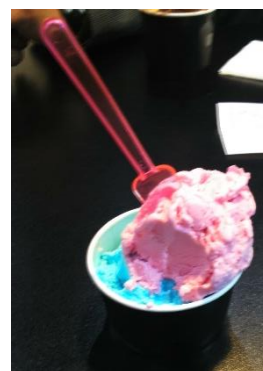
Mi comida favorita es el helado